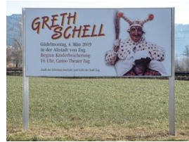
F12-Kulturplakate an Stadteingängen